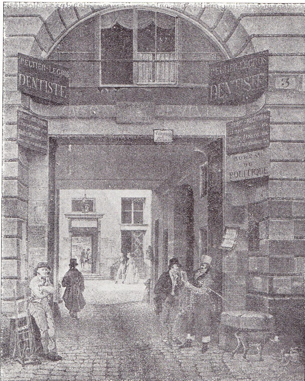
HÔTEL BULLION, RUE JEAN-JACQUES-ROUSSEAU.

D'après une gravure du 17 ème siècle.